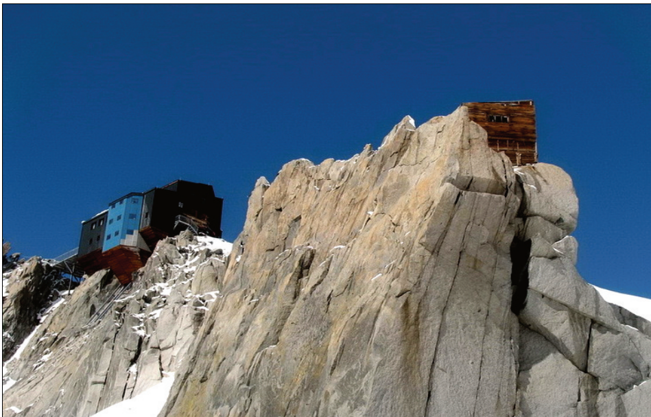
Ryc. 3. Schronisko górskie Cosmique (po lewej) i schron alpinistyczny w masywie Mont Blanc

Poza schroniskami górskimi popularne są także schrony górskie, służące jako awaryjne miejsce noclegu w razie załamania pogody. Udostępniane są bezpłatnie w rejonach o największej aktywności alpinistów (ryc. 3), jak na przykład w pobliżu schroniska Cosmique oraz Vallot.