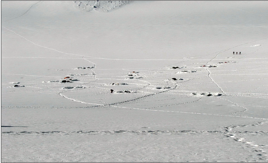
Ryc. 6. Obozowisko w masywie Mont Blanc pod Aiguille du Midi w lipcu 2007 r. Fig. 6. The encampment in the Mont Blanc massif under the Aiguille du Midi in July 2007

Osoby, które przybywają w rejon Mont Blanc, na miejsce zakwaterowania w miejscowościach leżących u podnóża masywu wybierają najczęściej kempingi. Wśród Polaków znacznym uznaniem cieszy się kemping w Les Houches ze względu na niskie koszty, dobre zaplecze sanitarne oraz bliskie położenie przy dolnej stacji kolei linowej. Z przeprowadzonych obserwacji wynika, że z kempingu korzystają nie tylko indywidualni turyści, ale także zorganizowane grupy komercyjne różnych narodowości (tab. 4).