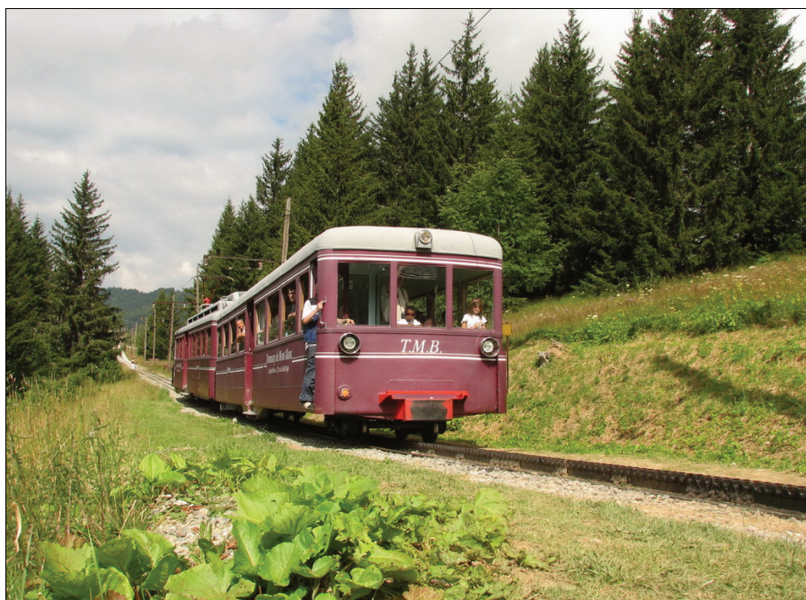
Ryc. 2. Tramwaj kursujący między Le Fayet a Nid d'Aigle Fig 2. The tram operating Le Fayet – Nid d'Aigle route

Jednym z ważniejszych środków transportu w masywie Mont Blanc jest uruchomiona w 1955 r. kolej linowa na Aiguille du Midi. Na wysokości 1035 m n.p.m. w Chamonix kolejka rozpoczyna pierwszy etap, by dotrzeć do Plan de l'Aiguille, położonego na wysokości 2309 m n.p.m. Drugi odcinek kolei dociera do wysokości 3802 m n.p.m. Warto zaznaczyć, że trasę tę kolej pokonuje bez udziału podpór. Na górnej stacji znajdują się: sklep z pamiątkami, poczta, kawiarnia oraz toalety. Turyści mają również możliwość wjazdu na iglicę, na której wybudowano taras widokowy. Można się tam dostać 40-metrową windą, wybudowaną wewnątrz górotworu. Kolej linowa na Aiguille du Midi jest jedną z najdłuższych na świecie. Pokonuje różnicę wysokości 3800 m między dolną i górną stacją. Dzięki skomunikowaniu kolei linowych od stron francuskiej i włoskiej na Pointe Helbronner (3462 m n.p.m.), prowadzącej z Doliny Aosty, można przejechać cały masyw Mont Blanc (Mackiewicz 2014). Ważną funkcję komunikacyjną spełnia kolej zębata z Le Fayet (584 m n.p.m.) do Nid d'Aigle (2372 m n.p.m.), która pokonuje różnicę 1800 m wysokości (ryc. 2). Jest ona najczęściej wykorzystywana przez alpinistów podążających drogą normalną na wierzchołek Mont Blanc.