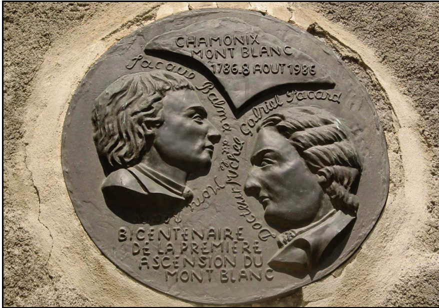
Ryc. 4. Tablica w Chamonix upamiętniająca zdobycie Mont Blanc przez Jacquesa Balmata i Michela Gabriela Piccarda