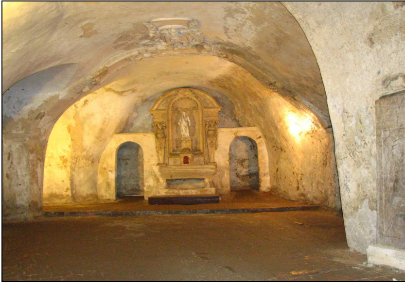
Fot. 4. Svatý Jan pod Skalou Photo 4. Svatý Jan pod Skalou

tach 1710-1711. Początkowo zastępowała kościół, który zbudowano we wsi w 1735 r. W późniejszym okresie kaplicę wykorzystywano jako miejsce pielgrzymkowe. W komorach jaskini miejscowy rzeźbiarz Schielle wyrzeźbił reliefy nawiązujące do scen z Tajemnic Różańca (Bílková i in. 2002). Od 2002 r. kaplica jest zamknięta, ale możliwe jest jej zwiedzanie (klucze dostępne w Urzędzie Miasta).