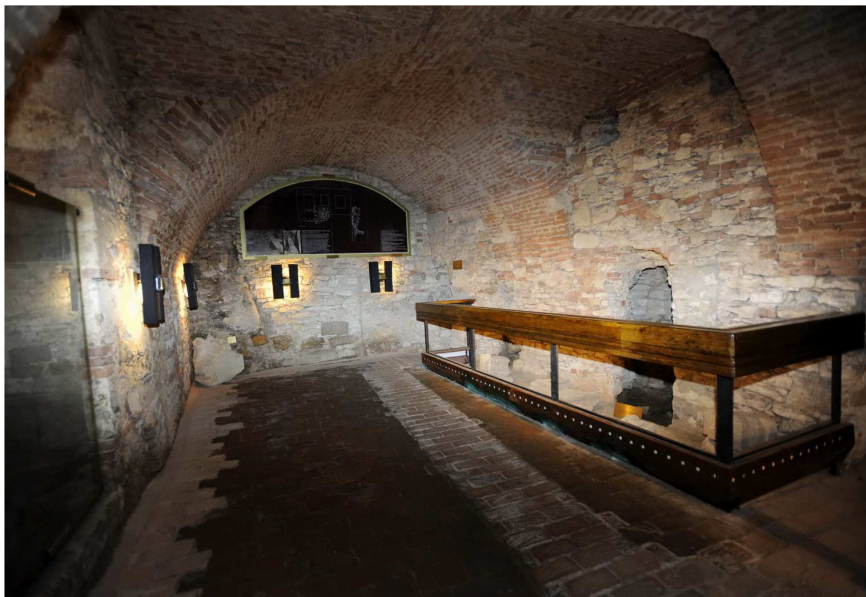
Fot. 3. Krypta pod kościołem św. Małgorzaty w Pradze

Pozostałe praskie krypty znajdują się w bazylice św. Jerzego oraz w kościele św. Małgorzaty na Brevnovie (fot. 3).