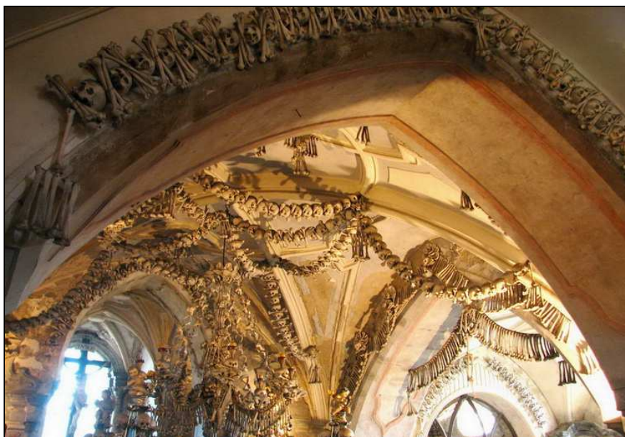
Fot. 1. Kaplica czaszek w Kutnej Horze Photo 1. Chapel of Skulls in Kutná Hora

W 1511 r. na wpół ślepy mnich rozpoczął układanie piramidy z czaszek i ludzkich kości. Kolejna duża liczba szczątków ludzkich przybyła po okresie wojny trzydziestoletniej (1618-1648). W 1661 r. kości przełożono, a kaplicę wyremontowano. Po reformach Józefa II majątek klasztorny zakupiła rodzina Schwarzenbergów z Orlika. Autorem wystroju krypty jest František Rint. Czaszki i kości zmarłych posłużyły jako materiał do dekoracji krypty (fot. 1), w tym wykonania ołtarzy, żyrandoli czy też herbu rodzowego książąt Schwarzenbergów (Kulich 2003, [2009?]).