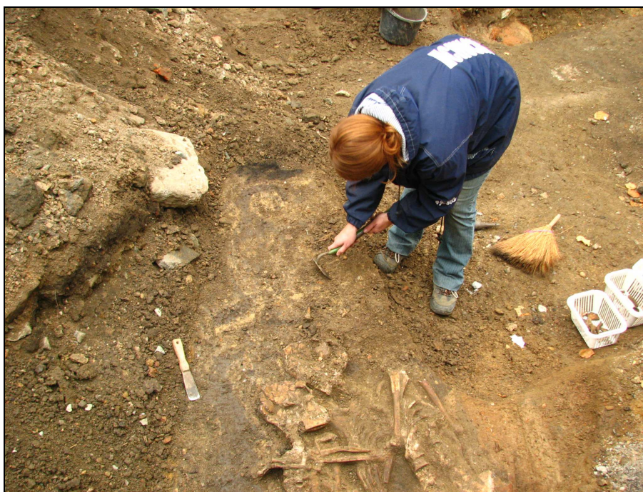
Fot. 2. Prace archeologiczne w Brnie we wrześniu 2007 r. Photo 2. The archeological works in Brno in September 2007

Jedną z większych czeskich kaplic jest kostnica w kościele św. Jakuba przy ul. Rašínova w Brnie. Jesienią 2001 r. rozpoczęto prace archeologiczne w jego pobliżu (fot. 2) i 30 cm pod powierzchnią znaleziono groby pochodzące z XIII-XVI w. Podczas prac natrafiono na komory przy południowej stronie kościoła wypełnione kośćmi. Według danych szacunkowych podziemia świątyni zawierały szczątki ok. 40-50 tys. osób (Hanuš 2008). Analizy antropologiczne wskazują, że kości należały do osób zmarłych w wyniku różnych epidemii oraz do ofiar wojny trzydziestoletniej (1618-1648). Projekt rewitalizacji i udostępnienia podziemi finansowany był z Regionalnego Programu Operacyjnego NUTS II dla regionu południowo-wschodniego 1 . Zwiedzanie obiektu umożliwiono turystom w 2012 r.